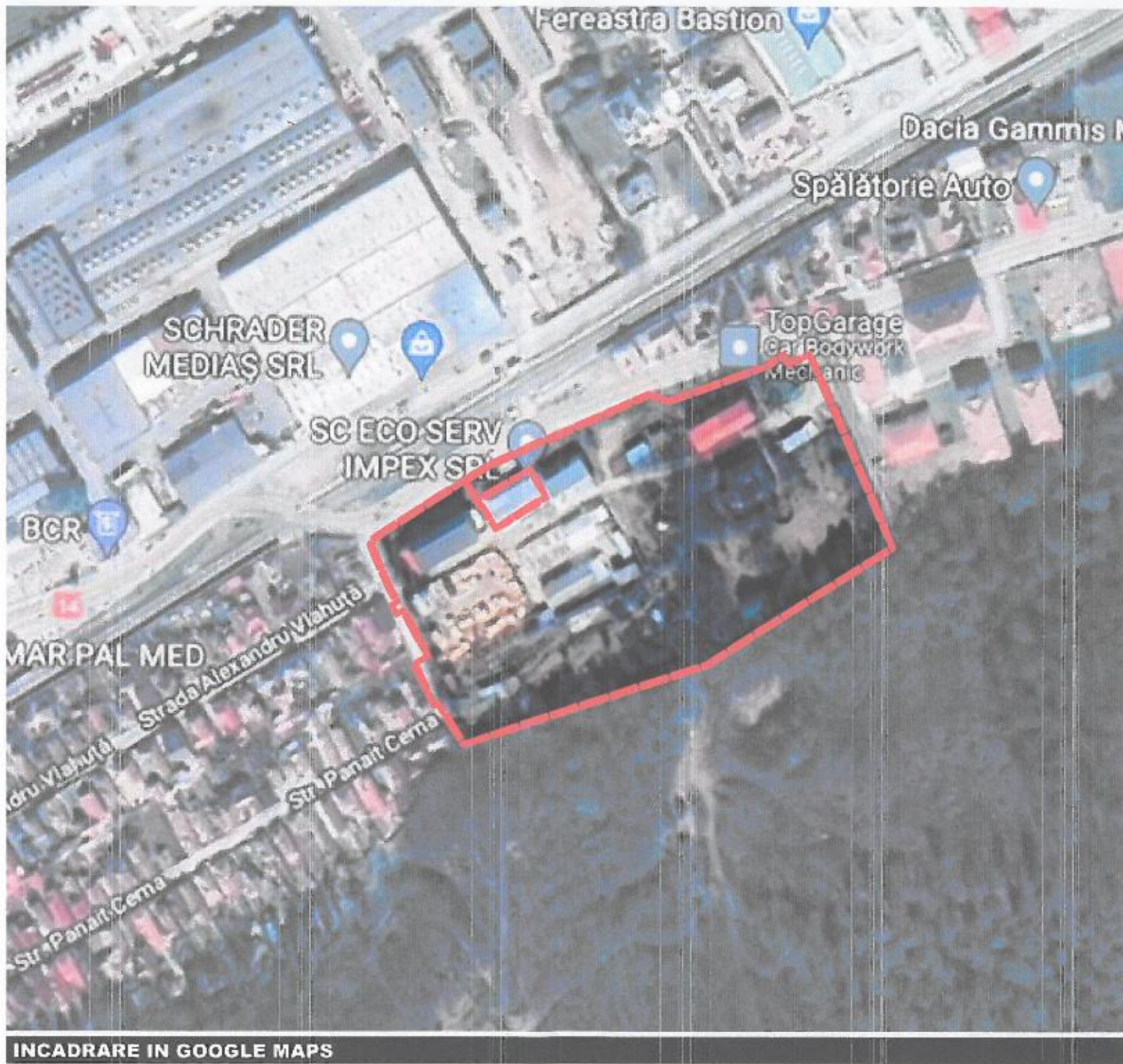
INCADRARE IN GOOGLE MAPS