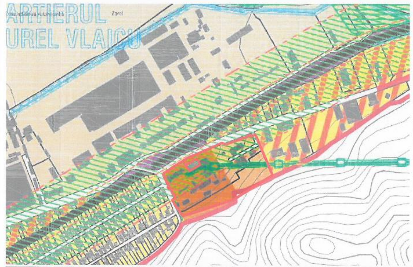
INCADRARE IN PUG - ZONIFICARE