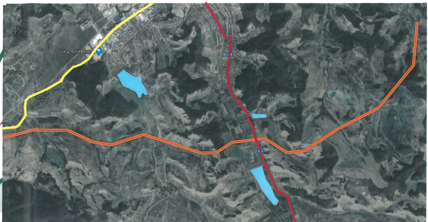
PROPUNERE OCOLITOARE (4 benzi) SC 1:55 000