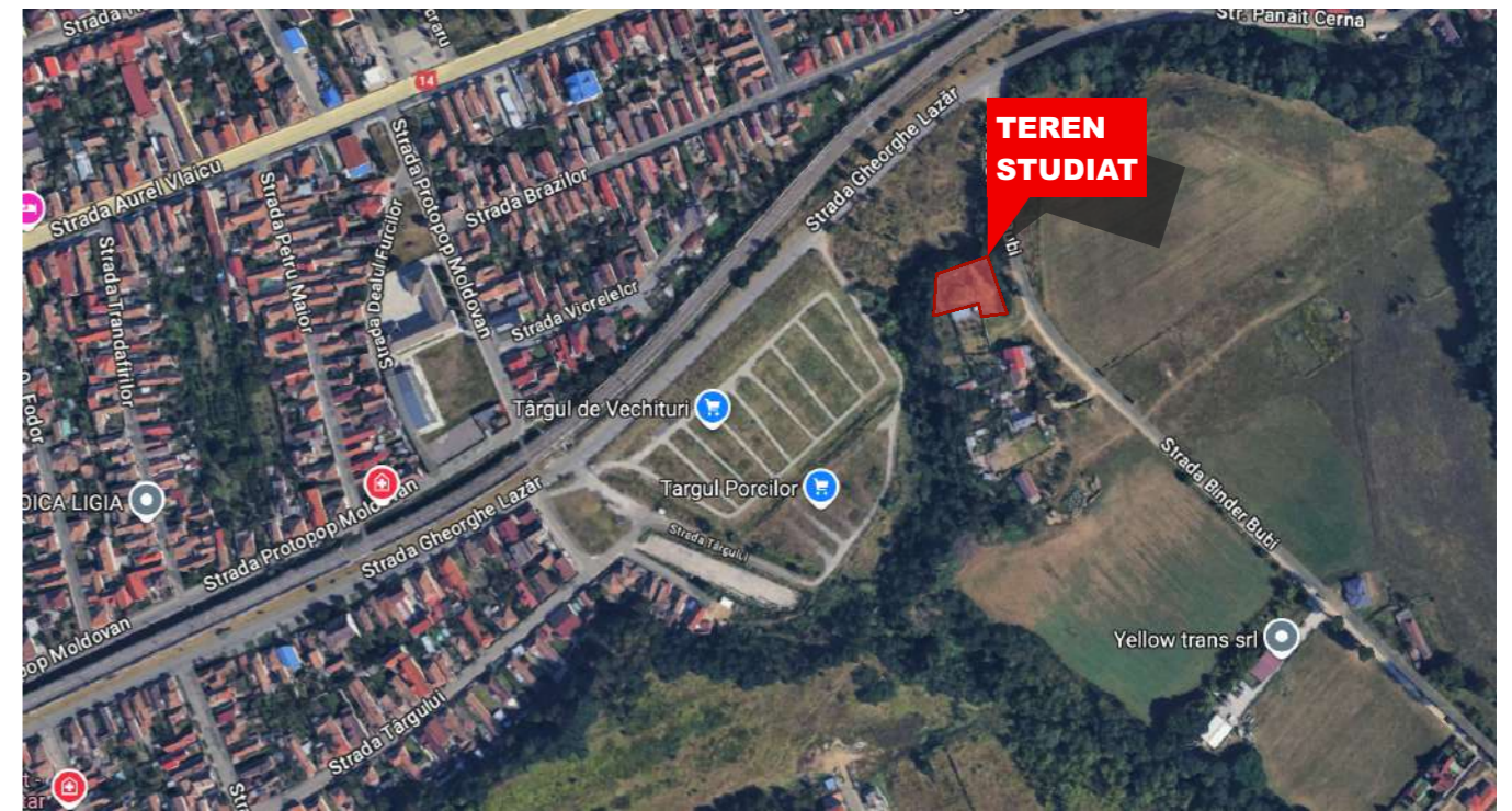
PLAN DE INCADRARE GOOGLE MAPS